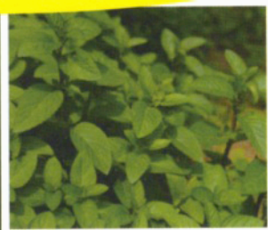
はっか(メントール)