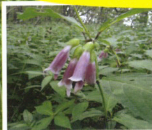
クチジャコウソウ